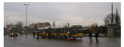
Wären Sie darauf gekommen? Das Foto zeigt tatsächlich die Endstelle der Metrobuslinie M41 am neuen Berliner Hauptbahnhof - ohne Wetterschutz und Bordstein.