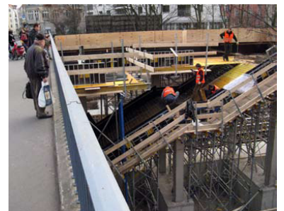
S-Bahnstation Kolonnenstraße im Bau. Man hätte es kaum geglaubt: Die seit 1987 versprochene Station nimmt Form an. Sie soll am 30. April 2008 eröffnet werden.