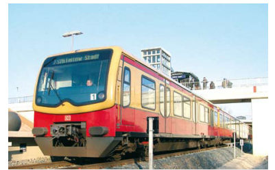
Zug der Baureihe 481 in Teltow Stadt. Ausgerechnet die modernsten Züge der Berliner S-Bahn dürfen aus sicherheitstechnischen Gründen maximal 80 statt 100 km/h fahren, bis die Bremstechnik nachgebessert wurde. Damit sind häufigere Verspätungen auf einigen Linien vorprogrammiert - vor allem auf eingleisigen Abschnitten.

Für die IGEB ist das nicht plausibel, weil dann auch andere Verkehrsunternehmen in