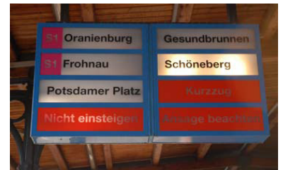
S-Bf Zehlendorf. Hier gibt es den alten Zugzielanzeiger aus BVG-Zeiten noch, der auf anderen Stationen abgebaut wurde. Häufig leuchtet aber nur »Anzüge beachten«.