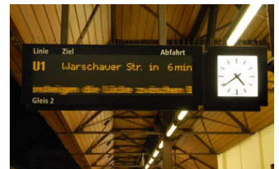
U-Bf Schlesisches Tor. Auf allen Stationen der U-Bahn informiert die BVG in dieser Qualität. Davon können S-Bahn-Fahrgäste auf vielen Stationen nur träumen.