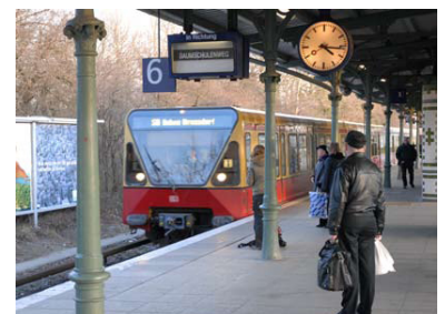
S-Bahnhof Schöneweide. Ausgerechnet zum Streikbeginn am 1. Februar wurden auf dem Bf Schöneweide Richtung Innenstadt die Bahnsteigaufsicht abgezogen und die Zugzielanzeiger auf »Richtung Baumschulenweg« eingestellt. Viele Fahrgäste waren deshalb verunsichert, ob die Züge pendeln bzw. welcher Zug auf den Südring oder Ostring fährt. Ein unhaltbarer Zustand!