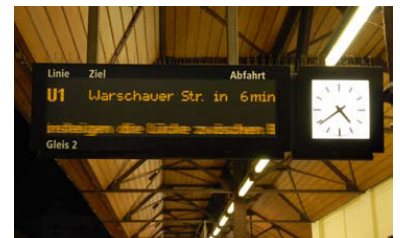
U-Bf Schlesisches Tor. Auf allen Stationen der U-Bahn informiert die BVG in dieser Qualität. Davon können S-Bahn-Fahrgäste auf vielen Stationen nur träumen.