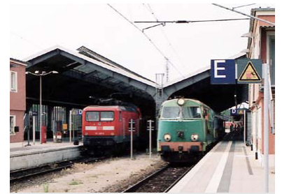
DB und PKP im Grenzbahnhof Frankfurt (Oder).

Berlin--Cottbus--Forst--Teuplitz (Tuplice): Ausbau für eine Streckengeschwindigkeit von 160 km/h im Abschnitt Berlin--Cottbus sowie 2-gleisig zwischen Lübbenau und Cottbus. Im Abschnitt Cottbus--Forst sind keine Ausbaumaßnahmen vorgesehen. Gegebenenfalls erfolgt die Sanierung des Streckenabschnitts im Rahmen von Bestandsnetzinvestitionen, insbesondere die Brücke über die Spree.