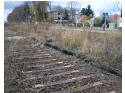
Abgebautes Gleis im Bahnhof Golzow auf der Ostbahn. Eine vielfach nur geringe Kapazität weisen die grenzüberschreitenden Strecken Richtung Polen auf. Verschärft wurde die Situation in den letzten Jahren durch Infrastrukturrückbau. (Foto: Christian Schultz, November 2007)