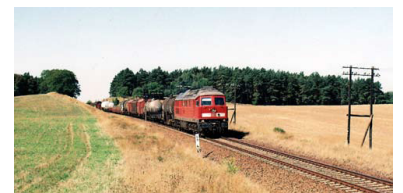
Bereits 2006 wurden Güterzüge über die Ostbahn umgeleitet, als die Oderbrücke in Frankfurt kurzzeitig gesperrt war. Wegen fehlender Kreuzungsmöglichkeiten auf der eingleisigen Strecke musste der Personenregionalverkehr deshalb stark eingeschränkt werden. Eine ähnliche Situation ist auch für 2008 angekündigt.