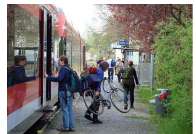
Seit 1. Mai fährt wieder die Bahn RB54 nach Rheinsberg. Bereits am ersten Tag wurde der Zug gut genutzt. Es verkehren DB-Triebwagen der Baureihe 646. Die Brückenbauarbeiten in Lindow sind erfreulicherweise rechtzeitig fertig geworden.