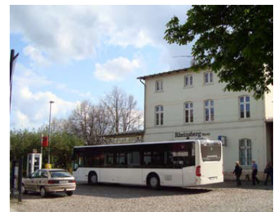
Am Bahnhof wartet bereits der »Rheinberger Seenbus« auf die Fahrgäste, die mit dem Zug ankommen. Die Abfahrtszeiten sind auf den Bahnfahrplan abgestimmt.