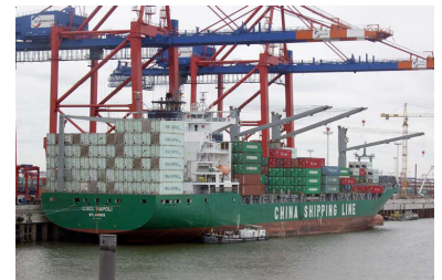
Containerschiff im Hafen Hamburg mit einer Stellplatzkapazität von ca. 2700 TEU. Mittlerweile gibt es noch viel größere, die eine Ladekapazität von über 13 000 TEU haben. Dagegen wirkt dieses hier geradezu mickrig.

Das Problem: Der Umbau in Maschen muss unter »rollendem Rad« erfolgen, denn jährlich frequentieren 800 000 Wagen den Bahnhof. Und es werden noch viel mehr werden. Allein der Hafen Hamburg will nach eigenen Angaben Rotterdam den 1. Platz in Europa abringen und bis 2015 über 500 Mio. Euro investieren, um seinen Umschlag auf 18 Mio. TEU pro Jahr auszubauen. 4,5 Mio. TEU so ist geplant, sollen dann per Bahn ins Land geschafft werden. Zum Vergleich: So viel ungefähr betrug 2006 mit 4,8