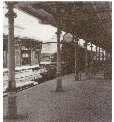
D 354 NACH PARIS IM BF BERLIN-WANNSEE