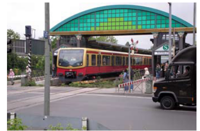
S-Bahnhof Buckower Chaussee mit dem Ende der 1980er Jahre errichteten markanten Torbauwerk. Jetzt, beim Umbau des Bahnübergangs in eine Straßenüberführung, soll zu Lasten der hier ein- und aussteigenden Fahrgäste gespart werden.

Gerade der Verkehrswert des Umsteigeknotens Buckower Chaussee kann sowohl für Berliner als auch Brandenburger Fahrgäste deutlich verbessert werden, wenn hier neben der S-Bahn auch für die Regional- Express- bzw. künftigen Flughafen-Express-Züge ein Halt eingerichtet wird. Neben einer verbesserten Auslastung des Flughafen-Expresses bewirkt diese Maßnahme auch die dringend erforderliche