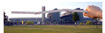
Dach zu kurz? Proportionen zerstört? Luxusdebatte? Scheinprobleme? Es ist alles eine Frage des Maßstabs.