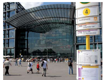
Kurzer Umsteigeweg zwischen Hauptbahnhof und Flughafenbus TXL. Seit dem Fahrplanwechsel im Dezember 2007 hält der TXL endlich auch - wie vom Fahrgastverband IGEB gefordert - am Washingtonplatz. Die BVG hielt diesen Halt für überflüssig, doch die Senatsverwaltung für Stadtentwicklung als Besteller der Leistungen setzte ihn durch. Die Positionsnummer 4 am Haltestellenmast ist Vorbote einer weiteren Verbesserung, denn vor dem Hauptbahnhof werden derzeit zwei große Abfahrtsplaner für die BVG-Busse aufgestellt, die die Orientierung der Fahrgäste deutlich erleichtern sollen.