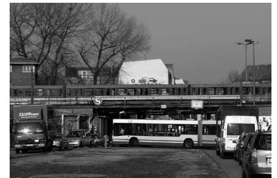
Rudower Chaussee am S-Bahnhof Adlershof. Während die Busse im Stau stehen, liegt der für die Verlängerung der Straßenbahn frei gehaltene Mittelstreifen brach. Nun droht im September sogar der Verfall des Planungsrechts für den Straßenbahnbau.