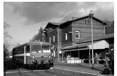
Bahnhof Putitz und Sonderfahrkarte für den letzten Betriebstag am 9. Dezember 2006. Zu diesem Anlass setzte die Prignitzer Eisenbahn PEG noch einmal einen ihrer alten Uerdinger Tiebwagen ein, mit denen vor 10 Jahren in Putitz alles begonnen hatte.