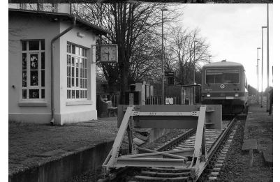
Bahnhof Rheinsberg mit Zug nach Löwenberg (RB 54). Bahnverkehr nach Rheinsberg gibt es seit dem Fahrplanwechsel allerdings nur noch freitags bis sonntags und die Direktverbindung nach Neuruppin wurde ganz aufgegeben.