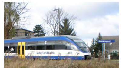
Golzow (Oderbruch), zurückgebaut vom Bahnhof mit Begegnungsmöglichkeit zum eingleisigen Haltepunkt.

Frage: Welche konkreten Anstrengungen unternimmt die Landesregierung, um vor dem Hintergrund der prognostizierten hohen Zunahme des Straßengüterverkehrs aus und in die östlichen Nachbarländer die DB AG zu einer langfristigen bedarfsgerechten Vorhaltung der Schieneninfrastruktur auf der »Ostbahn« zu bewegen,