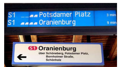
Zugzielanzeiger auf der S 1, links Julius-Leber-Brücke, rechts Zehlendorf. Die Gegenüberstellung zeigt, dass den Fahrgästen in Zehlendorf nicht nur vorenthalten wird, wohin der nächste Zug fährt, sondern auch wann er kommt, wie lang er ist und welcher Zug folgt. Auch der Verweis der S-Bahn GmbH, dass das Ziel vom Triebfahrzeugführer angesagt werde, befriedigt nicht, weil damit Hörgeschädigte und viele Ausländer ausgegrenzt werden. Entsprechend häufig wurde die S-Bahn beim Fahrgastsprechttag für den Rückbau der Fahrgastinformation kritisiert. Hinzu kam, dass kurz zuvor beim Regionalverkehrsprechttag der Vertreter von DB Station & Service jede Verantwortung für diese Entwicklung auf den S-Bahnhöfen von sich wies - das sei allein Sache der S-Bahn GmbH.