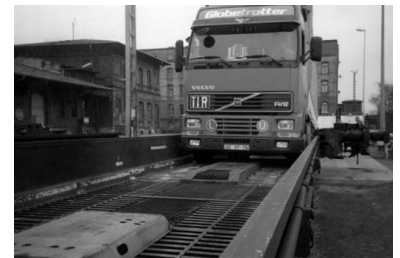
Der Lkw beim Verladevorgang.

Dieser Wagentyp ist von Bombardier im Werk Bautzen hergestellt und an die italienischen Staatsbahnen geliefert worden. Als Flachland-Bauvariante verfügt er über eine Lastgrenze von 44 Tonnen und ist vom EBA Minden für Geschwindigkeiten von 100 km/h zugelassen (vorgestellt auf der InnoTrans 2006). Er ist in seinen tragenden Komponenten so konstruiert, dass die Beladung und Entladung der 30 Stellplätze im Blockzug technisch in minimalen Zeiten IT-gesteuert und -überwacht vonstatten gehen kann.