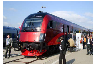
Der Railjet der ÖBB auf der InnoTrans in Berlin im September 2008.