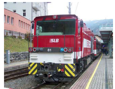
Die neue Fahrzeuggeneration auf der Pinzgaubahn: Gmeinder-Lok mit Mittel- und Steuerwagen von Molinari vor der Abfahrt des Tagungs Sonderzuges nach Mittersill in Zell am See.