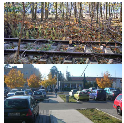
Standort des geplanten Haltepunktes Bad Saarow Klinikum (oben). Unmittelbar hinter dem schmalen Baumstreifen befindet sich der Parkplatz (unten) und 50 Meter weiter erreicht man den Klinikeingang (neben dem Flachbau in der Mitte).