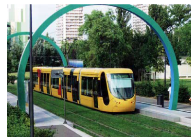
In den französischen Städten weis man die Straßenbahn nicht nur als modernes und attraktives Verkehrsmittel zu schätzen, sondern setzt sie auch bewusst als Element der Stadterneuerung und zur Stärkung der Innenstädte ein. In Mulhouse (Mühlhausen) wird die Straßenbahn in Kürze nach Karlsruher Vorbild auf Eisenbahnstrecken weit in die Region hinaus fahren.