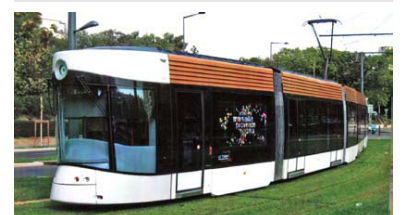
Straßenbahn mit maritimen Design: Schon in den 1990er Jahren erkannte man in der französischen Hafenstadt Marseille, dass der U-Bahn-Ausbau nicht mehr finanzierbar ist und entschied sich für ein modernes Straßenbahnsystem.