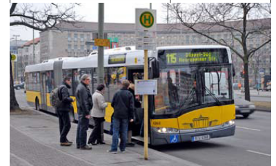
Bus 115 am Fehrbelliner Platz zur Abfahrt nach Düppel-Süd. Dort, so die Rechnung der Gutachter, soll der Bus eine geringfügig zum Regionalbahnhof Düppel-Kleinmachnow verlegte Endstelle erhalten, wofür Kosten eines zusätzlichen Fahrzeugs und jährlich 1905 zusätzliche Fahrerstunden berechnet wurden. Sinnvolle Busnetzanpassungen wurden demgegenüber nicht untersucht und berechnet.