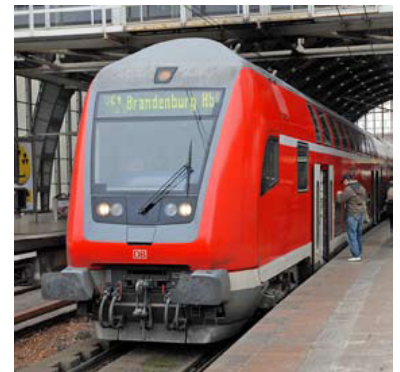
RE 1 von Frankfurt (Oder) nach Brandenburg Hbf in Berlin Alexanderplatz. Fast alle für die Wiederinbetriebnahme der Stammbahn untersuchten Varianten sehen eine Brechung jedes oder jedes zweiten RE 1 in Berlin vor - und wurden somit von vornherein für den Papierkorb erarbeitet.

So wird für das Land Berlin behauptet: »Maßgeblich für die Potsdamer Stammbahn sind die Entwicklungen im Bezirk Steglitz-Zehlendorf« (Seite 22). Diese Bewertung vernachlässigt die Bedeutung des Bezirkes Mitte, in dem für die Stammbahn im Mitfall drei Halte (Potsdamer Platz, Hauptbahnhof, Gesundbrunnen) vorgesehen sind