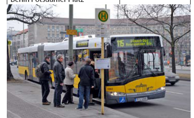
Bus 115 am Fehrbelliner Platz zur Abfahrt nach Düppel-Süd. Dort, so die Rechnung der Gutachter, soll der Bus eine geringfügig zum Regionalbahnhof Düppel-Kleinmachnow verlegte Endstelle erhalten, wofür Kosten eines zusätzlichen Fahrzeugs und jährlich 1905 zusätzliche Fahrerstunden berechnet wurden. Sinnvolle Busnetzanpassungen wurden demgegenüber nicht untersucht und berechnet.