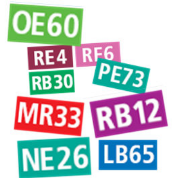
Präfixwirrwar (Grafiken: Holger Mertens)

Das Problem mit den unternehmensabhängigen Linienbezeichnungen und dem »B« hat auch das brandenburgische Verkehrsministerium erkannt und bei der Erarbeitung des Landesnahverkehrsplans 2008 - 2012 nach Alternativen gesucht. Doch zur Lösung werden im Kapitel »Ausblick Zielnetz 2020« zwei völlig neue und zusammenhangslose Bezeichnungen aus dem Kauderwelsch-Ärmel geschüttelt: BrandenburgExpress (BE) und RegionalLinie (RL). Vernachlässigt wird bei dieser Bezeichnung, dass der Brandenburgexpress nicht nur durch Brandenburg, sondern auch durch Berlin und andere Bundesländer fährt. Außerdem lässt sich die Abkürzung BE eher mit anderen Sachen assoziieren: Broteinheiten, Bewertungseinheiten, die