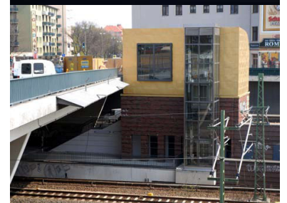
S-Bahnhof Messe Nord (Witzleben), neuer Ausgang zum ICC und Messegelände. Trotz Bestellung des Landes Berlin dauerte es Jahre, bis die DB 2008 mit dem Bau dieses wichtigen Ausgangs begann. Und seit Monaten verschleppt sich die Fertigstellung.