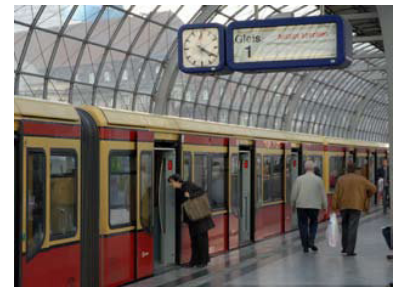
Berlin-Spandau (oben) und Berlin-Südkreuz (unten). Zwei wichtige Fernbahnhöfe mit hohem Fahrgastaufkommen ohne angemessene Information für S-Bahn-Fahrgäste.