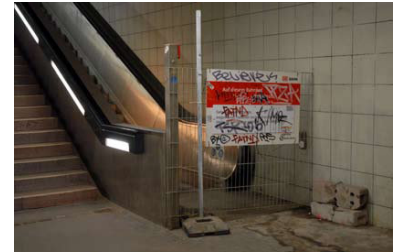
Bundesplatz. Seit Monaten ist die DB-Fahrtreppe von der U 9 (Bahnsteig Richtung Osloer Straße) zum S-Bahn-Ring außer Betrieb.