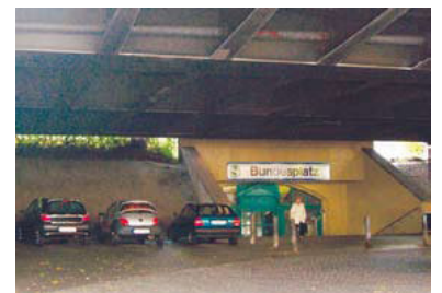
Wie der Stadtautobahnbau die Stadt zerstört hat, sieht man am S-Bahnhof Bundesplatz. Ähnliches droht nun am S-Bahnhof Treptower Park.