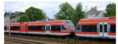
Jeder Halt eines Regionalzuges kostet aktuell in Falkensee 2,60 Euro netto.

Das Umsteigen in Falkensee sowie eine Fahrzeitverlängerung entspricht in keinem Fall einer modernen, angemessenen und kundenfreundlichen Bahnplanung. Gerade in der Zeit ständig steigender Kraftstoffkosten ist mit einer Zunahme von Fahrgästen in