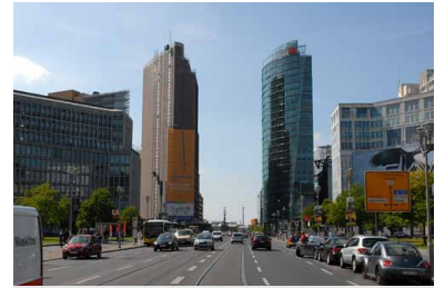
Leipziger Straße. Hier liegen bereits Straßenbahngleise für die Tram vom Alex zum Kulturforum. Aber wenn auf dem Mittelstreifen der Potsdamer Straße der Boulevard der Stars gebaut wird, dann kann hier keine Straßenbahn fahren.

Da in dieser Stadt entgegen aller öffentlichen Bekundungen die Straßenbahn und die sie betreffenden Planungen immer an letzter Stelle kommen, sind die Entwürfe entsprechend ausgefallen. Drei der sieben Wettbewerbsbeiträge ignorieren die Straßenbahn komplett, die Trasse kommt nicht einmal pro forma als Skizze in den Entwürfen vor. Hier vertraut man wohl auf das »Stufenkonzept« der