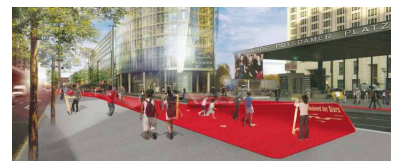
Preisgekrönter Entwurf vom Büro GRAFT mit ART+COM AG für den Boulevard der Stars. Wird er so realisiert, kann die auf dem Mittelstreifen der Potsdamer Straße geplante Straßenbahn nicht mehr gebaut werden. (Abbildung aus: Senatsverwaltung für Stadtentwicklung, Ergebnisprotokoll, Juni 2009.)