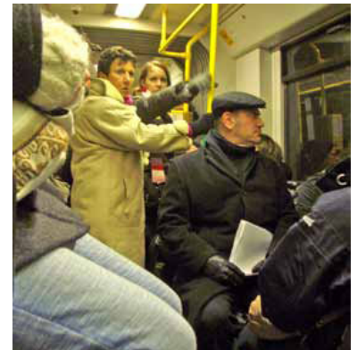
Überfüllte Straßenbahn auf der Linie M4, an einem ganz normalen Werktag um 19 Uhr. Die Fahrgastzahlen der BVG, insbesondere bei der Straßenbahn, entwickeln sich besser als vorhergesagt. Deshalb müssen die neuen Straßenbahnzüge vom Typ Flexity unbedingt in der langen Version bestellt werden.