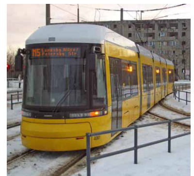
Vom Flexity sollen ca. 100 Stück angeschafft werden. Wie lang die Fahrzeuge sein werden, wird noch diskutiert.