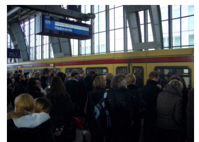
Friedrichstr: Warten auf den Pendelzug.