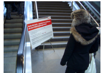
Hbf: Am Wochenende des Pendelverkehrs informierte der Aufsteller über Regional-Zug-Zusatzangebot...das jedoch nur Montag bis Freitag morgens und nachmittags gilt. Vom Pendelverkehr war nichts zu lesen.