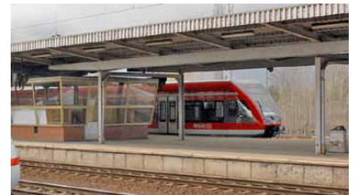
Oben: RB 22 nach Potsdam im Flughafenbahnhof Schönefeld. Unverständlicherweise sollen alle Fern- und Regionalbahnsteige nach Fertigstellung der neuen BBI-Ostanbindung vollständig abgerissen werden, anstatt wenigstens einen Bahnsteig für Dieselzüge und für den Havariefall zu erhalten. Unten: Gleich nach dem Planfeststellungsbeschluss vom 19. Februar wurde die Trasse für die BBI-Ostanbindung vollständig gerodet.