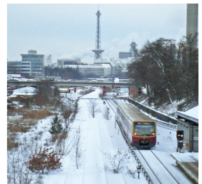
Bäume wachsen heute auf den beiden schneebedeckten Gütergleisen des südlichen Innenrings, hier am S-Bf Hohenzollerndamm.