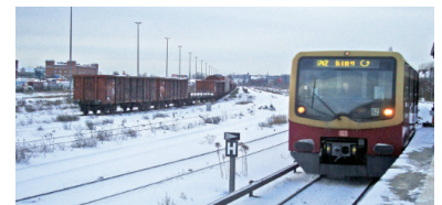
Auf Teilen des südlichen Berliner Innenrings gibt es heute noch Güterverkehr, wie hier am Güterbahnhof Tempelhof. Bis 2014 will die DB auch die Gütergleise auf dem Abschnitt Halensee--Tempelhof wieder aufbauen.