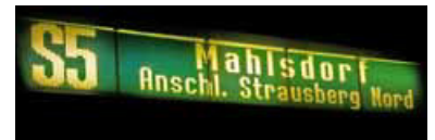
Ob der Anschluss klappt, ist oft Glückssache.

Abends ist die S 5 planmäßig in Mahlsdorf gebrochen, um nicht mit 8-Wagen-Zügen bis nach Strausberg hinausfahren zu müssen. Die Gründe sind nachvollziehbar: überdimensionierte Zuglänge, Wagenkilometerund Energieeinsparung, Vandalismusgefahr, geringere gefühlte soziale Sicherheit. In Mahlsdorf besteht üblicherweise Anschluss an einen 4-Wagen-Zug nach Strausberg bzw. alle 40 Minuten nach Strausberg Nord. Da der Abschnitt auf weiten Teilen eingleisig ist, pflanzt sich