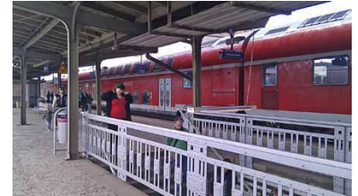
Bahnhof Prenzlau mit RE 3 kurz vor Beginn der Bauarbeiten. Der RE 3 verbindet die Kreisstadt der Uckermark mit Berlin und Stralsund.