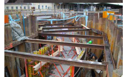
Bahnhof Prenzlau. Der Tunnel zum Mittelbahnsteig ist verwahrlost und nicht barrierefrei. Der neue Tunnel erhält Rampen bzw. Aufzüge und verbindet zugleich die Stadtteile beiderseits der Bahn.