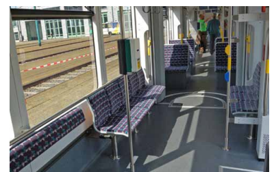
Eines der beiden großen Mehrzweckabteile mit Blick in das mittlere Fahrwerksmodul. Auffällig die Längsbestuhlung und die Stehplatzfläche, die aber zu wenige Festhaltenmöglichkeiten bietet.