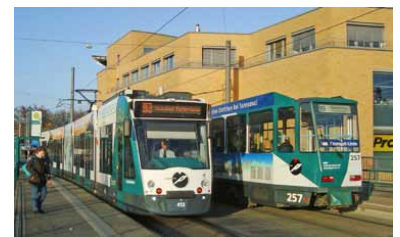
Bisher fahren in Potsdam der Typ Combino (Niederflur, links) und die modernisierten Hochflur-Tatrawagen (rechts), hier an der Haltestelle Lange Brücke.