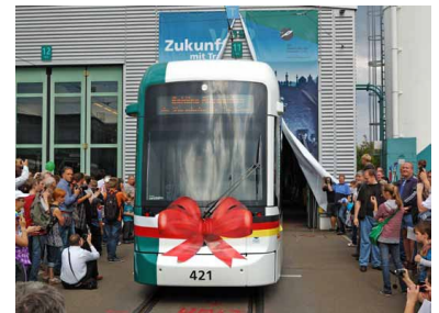
Präsentation des ersten Variobahn-Fahrzeugs vor den Fahrgästen am 17. September 2011 auf dem Betriebshof der ViP in Potsdam. Bei den anschließenden Probefahrten mit Fahrgästen traten einige Kinderkrankheiten auf, die nachgebessert wurden.

Nach Bekanntgabe der Vergabeabsicht an Stadler Pankow erhob Siemens dagegen Einspruch vor der Vergabekammer. Nach der Abweisung zog Siemens vor Gericht und unterlag. So stand der Vergabe und damit dem Vertragsabschluss mit der Firma Stadler Pankow GmbH nichts mehr im Weg. Am 30. Januar 2009 bestellte die ViP