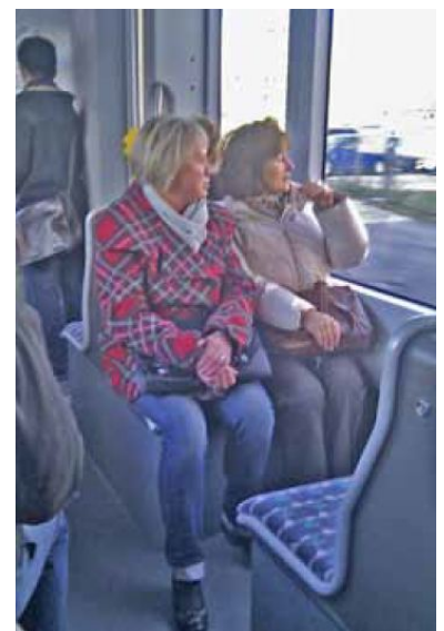
Kuschelsitze. Die anderthalb breiten Sitze im Mittelmodul sind für 2 schlanke Personen und Körperkontakt geeignet.