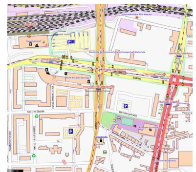
Die Straßenbahnschleife am Bahnhof Cottbus, Vorschlag von ProTram-Cottbus. Um den Vergleich mit der städtischen Planung zu erleichtern, ist der Kartenausschnitt der Stadt im Plan von ProTramCottbus durch eine gepunktete Linie umgrenzt. (Karte: OSM, Eintragungen: ProTramCottbus)