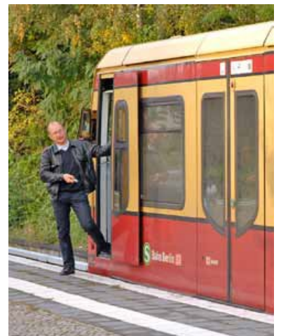
Zur Zugabfertigung muss der Triebfahrzeugführer aussteigen, weil die Bahnsteigaufsichten vor der Genehmigung technischer Systeme zur Zugabfertigung abgeschafft wurden. Durch das Aussteigen wird der Führerraum im Sommer zu heiß, was zu Zugausfällen führte, und im Winter zu kalt, wodurch sich so mancher erkältete.