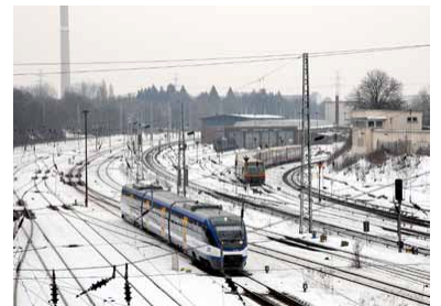
S-Bahn-Betriebswerkstatt Friedrichsfelde. Im Januar 2010 wurde sie zunächst provisorisch in Betrieb genommen. Jetzt wird sie ausgebaut und bleibt mindestens bis 2017 erhalten.

Bei den Wintervorbereitungen arbeitet die S-Bahn Berlin eng mit DB Netze zusammen, das die infrastrukturellen Rahmenbedingungen für einen zuverlässigen Betrieb in der kalten Jahreszeit sicherstellt. Bis zum 31. Oktober werden alle erforderlichen Arbeiten abgeschlossen. Weichenantriebe, Weichenheizungen, Signale