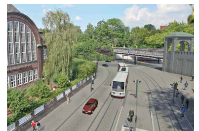
Der U-Bahn-Knotenpunkt Kellinghusenstraße soll die vorläufige Endhaltestelle der ersten Stadtbahnstrecke werden (Visualisierung: Hamburger Hochbahn AG)