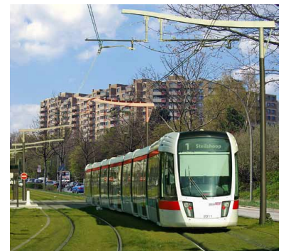
Nach 40 Jahren könnte die Hochhaussiedlung Steilshoop endlich ihren versprochenen Bahnanschluss bekommen.