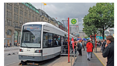
Am 20. Juni konnten die Hamburger schon einmal in einem aus Bremen geliehenen Stadtbahnwagen Probe sitzen.