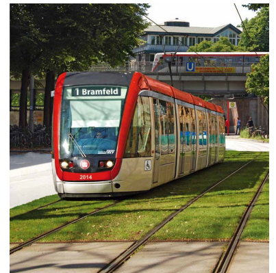
Noch ist es eine Vision: Ein Stadtbahnzug gleitet auf begrünten Gleisen durch die Hudwalckerstraße in Hamburg-Winterhude (Fotos und Idee: Christian Hinkelmann / Montage: Holger Mertens)

Damit hat die von der GAL geleitete Behörde die einmalige Gelegenheit verpasst, das Thema Straßenbahn in der breiten Öffentlichkeit und in den Medien positiv zu besetzen und mögliche Kritik gleich im Keim zu ersticken. Selbst, als die - zuerst neutral berichtende - Lokalpresse im Jahr 2009 plötzlich begann, sich geschlossen auf