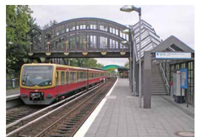
S-Bahnstation Buckower Chaussee. Sollten die aktuellen Pläne zur Dresdener Bahn ohne Korrektur umgesetzt werden, ist diese Fußgängerbrücke, die derzeit einen kurzen Umstiegsweg von und zum P+R-Parkplatz ermöglicht, künftig weitgehend nutzlos, denn eine Verlängerung über die künftigen Fernbahngleise ist bislang nicht vorgesehen. Außerdem fehlt in den Planungen noch immer ein Regionalbahnhof Buckower Chaussee.