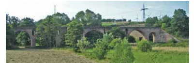
Viadukt auf der zurzeit stillgelegten Hunsrückbahn bei Nieder Kostenz. (Foto: Markus Braun, 2007)

© GVE-Verlag / signalarchiv.de - alle Rechte vorbehalten