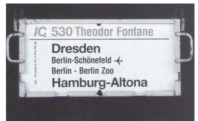
Nur Insider wissen, daß der Städtenamen ohne Zusatz den Hauptbahnhof bezeichnet. Deshalb fordert die IGEB, auf den Zugaufschildern die korrekten Bahnhofsnamen anzugeben.