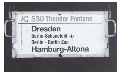
Nur Insider wissen, daß der Städtenamen ohne Zusatz den Hauptbahnhof bezeichnet. Deshalb fordert die IGEB, auf den Zugaufschildern die korrekten Bahnhofsnamen anzugeben.