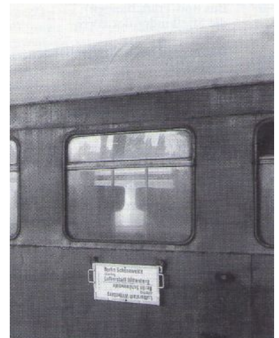
Vergammelter Wagen im R-Bahn-Einsatz (21.06.92). Anders als beim IC- und IR-Verkehr müssen Reisende im Regionalverkehr der DR oft noch in solchen Wagen fahren.

Getreu der Historie, wonach die Reisenden Richtung Süden aufgrund der topographischen und technischen Umstände längere Reisezeiten oder Umwegfahrten in Kauf nehmen mußten, wird dies mit der Einführung des IC--Verkehrs fortgesetzt. Die IC-Züge Berlin - München fahren nicht den direkten, schnelleren und betrieblich einfacheren Weg über Halle (Saale). Vielmehr werden den Reisenden die betrieblichen Zwänge des Kopfbahnhofes in Leipzig zugemutet. Der IC knickt in Bitterfeld von der Direktroute ab und kommt in Großkorbetha bei Weißenfels wieder auf diese. Die Reisezeit verlängert sich dadurch um bis zu 20 Minuten.