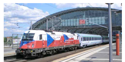
Berlin Hbf, Ankunft des neuen EuroCity Gdynia--Gdansk--Berlin. Zeitgleich wurde aber die einzige EC-Verbindung im Abschnitt Berlin--Szczecin eingestellt. Beim deutsch-polnischen Schienenpersonenverkehr besteht unverändert erheblicher Handlungsbedarf.