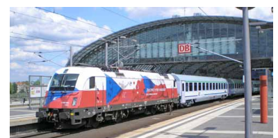
Berlin Hbf, Ankunft des neuen EuroCity Gdynia--Gdansk--Berlin. Zeitgleich wurde aber die einzige EC-Verbindung im Abschnitt Berlin--Szczecin eingestellt. Beim deutsch-polnischen Schienenpersonenverkehr besteht unverändert erheblicher Handlungsbedarf.