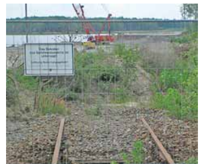
Bei den Untergrundsanierungsmaßnahmen am Rand eines ehemaligen Tagebaus im Bereich des Bahnhofs Lohsa kam es Anfang März 2012 zu einem Böschungsbruch. Die Folge sind Verzögerungen beim Ausbau der Bahntrasse in diesem Teilabschnitt.