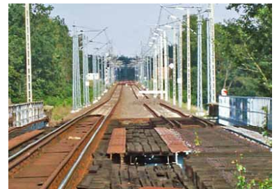
Die Weißbrücke an der Grenze Deutschland/Polen bei Horka im Jahr 2008. Auf polnischer Seite (Hintergrund) ist die Strecke bereits zweigleisig und elektrifiziert. In Deutschland geht es nur eingleisig mit Diesel weiter. Nun will auch Deutschland seinen Teil ausbauen.

Im Ergebnis des Ausbaus wird die Streckenkapazität und Betriebsqualität der Strecke Knappenrode--Horka--Grenze Deutschland/ Polen deutlich verbessert. So steigt die Kapazität von bislang 50 Zügen (davon 40 Güterzüge) auf bis zu 180 Züge (davon 160 Güterzüge). Aus dieser Steigerung der Zugzahlen resultiert u. a. das Erfordernis zur