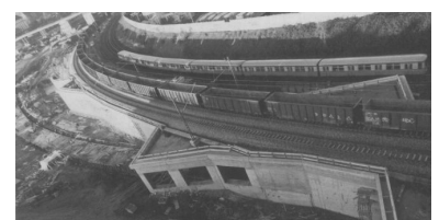
16. Januar 1995. Seit diesem Tag können wieder Fernzüge zwischen Pankow und Greifswalder Straße verkehren. Das Foto zeigt das neue Überführungsbauwerk der Fernbahn über die S-Bahn. Links im Bild sind die Aus- und Einfahrt der S-Bahn-Untertführung für die Züge von Schönhauser Allee nach Bornholmer Straße zu erkennen, die jetzt nach nordöstlich der