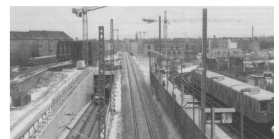
Anfang Januar 1995 am S-Bf Bornholmer Straße. Für die Inbetriebnahmen des Fernbahngleises von Pankow zur Greifswalder Straße finden letzte Arbeiten statt. Das zwischen der Rampe und dem S-Bahnsteig gelegene Gleis führt Schönholz nach Tegel.