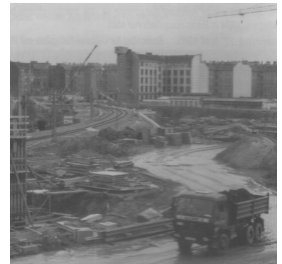
Baustelle Nordkreuz. Beide Fotos zeigen die S- und Fernbahngleise von Pankow (Stettiner Bahn) zur Greifswalder Straße (Nordring), oben im November 1992 vor dem Abbau der Fernbahngleise, hier im November 1994 nach deren Wiederaufbau. Bisher lagen sie auf einem Damm, jetzt führen sie über ein großes Brückenbauwerk