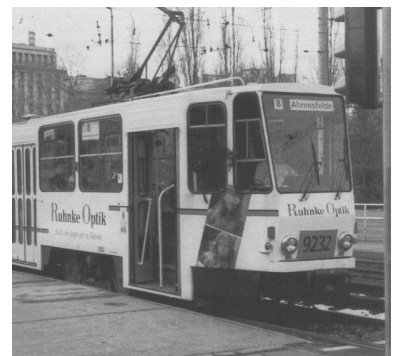
Wegen Bauarbeiten ist die Straßenbahnstrecke nach Ahrensfelde ab Raoul-Wallenberg-Straße für gut einen Monat außer Betrieb. Stattdessen verkehren zwischen Alt-Marzahn und Ahrensfelde Busse. Ärgerlich ist dabei die wieder einmal unzureichende information der Fahrgäste durch die BVG. Wer in der Innenstadt in eine Straßenbahn nach Ahrensfelde steigt (Bild: Tram an der Haltestelle Mollstraße) kann weder am Zug noch an der Haltestelle einen Hinweis auf die Bauarbeiten und die dadurch veränderte Linienführung sowie den Schienenersatzverkehr finden.