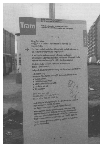
Ausführliche Informationstafeln gibt es erst im Bezirk Marzahn im Umfeld der Bauarbeiten. Positiv war, daß die BVG in "VBB aktuell", Heft 3/95 über die Bauarbeiten informierte, nur leider erschien das Heft erst nach dem Baubeginn am 6. März.