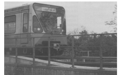
Endstation Lichterfelde Ost.

Als Konsequenz spitzte Senator Haase dann folgendermaßen zu: "Berlin muß diese Forderungen mit Nachdruck an den Bund herantragen und seine Zustimmung zur Bahnreform von einer klaren Regelung der Altlastenfrage abhängig machen." Nach