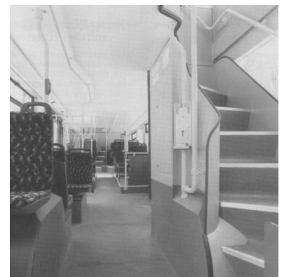
Der neue Doppeldecker weist im Unterdeck eine geräumige Gestaltung mit ebenem Wagenboden im vorderen und vergleichsweise niedrigen Podesten im hinteren Wagenteil auf. Auf dem ansteigenden Weg nach hinten werden sich etwas größere Fahrgäste allerdings (zumindest anfangs) ab und zu den Kopf stoßen. Im Unterdeck gibt es 25 und im Oberdeck 46 Sitzplätze. Zusammen mit den 23 Stehplätzen im Unterdeck ist der Bus für 94 Fahrgäste zugelassen.