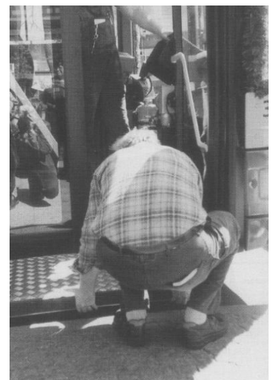
Neuer Bus, altes Problem. Bereits zwei Tage nach der Vorstellung versagte der Hublift an der Vordertür. Der auf der Linie 100 eingesetzte Bus mußte aus den Verkehr gezogen werden. Inzwischen ist wieder im Einsatz, aber die Verkehrsbetriebe und die Industrie müssen sich