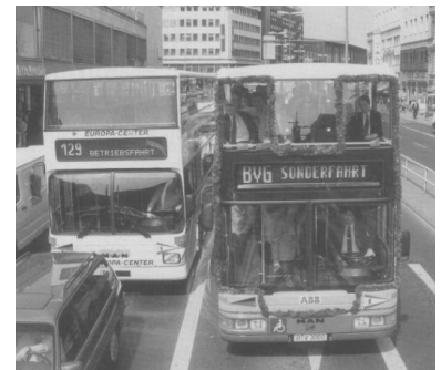
Alt und neu auf der Joachimstaler Straße bei der Vorstellung des Dreitürers am 5. Mai