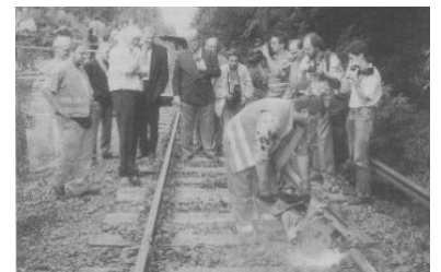
Am 14. August wurde am S-Bf Schulzendorf mit den Bauarbeiten für die Wiederinbetriebnahme der S-Bahn von Berlin-Tegel nach Hennigsdorf begonnen. Der symbolische Spatenstich bestand - denkbar unpassend für ein Lückenschlußprojekt