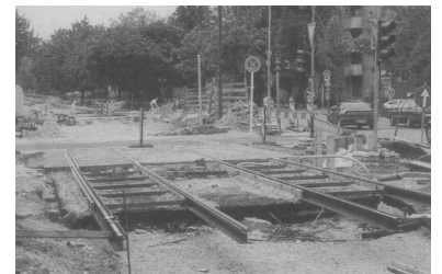
Bornholmer Ecke Grüntaler Straße im Mai 1995: Erstmals sind im Westteil Berlins wieder Straßenbahngleise verlegt worden.