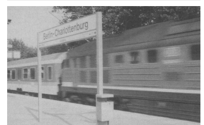
Nur denjenigen Reisenden, die einen äußerst sparsamen Informierenden Aushänge entdeckten, blieb der Anblick eines in Charlottenburg durchfahrenden RE erspart.