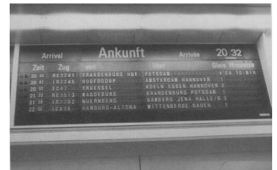
Seit dem 28. Mai gibt es auch zwischen der Stadt Brandenburg und Berlin Zoologischer Garten einen RegionalExpress. Doch aufgrund der noch bis zum Dezember andauernden Bauarbeiten auf dieser Strecke kommen viele Züge verspätet in Zoo an. Da die Kehzeit nur sechs Minuten beträgt, verzögert sich die Abfahrt entsprechend.

Besonders ärgerlich ist beim Thema Zuschläge, ähnlich wie bei der Fahrradmitnahme, daß die DB AG ihre Kunden nur unzureichend bzw. gar nicht informiert hat. In allen Publikationen zum Fahrplanwechsel Ende Mai ist der Zuschlag als verbindlich angekündigt. Doch nicht nur die Reisenden wurden (und werden) schlecht informiert. Ende Mai/Anfang Juni kam es vor, daß Zugbegleiter in RE-Zügen von der Aussetzung der Zuschlagsregelung nichts wußten.