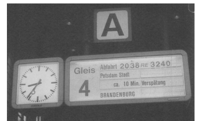
Deshalb hat die DB AG den Zwischenhalt in Berlin-Charlottenburg nach nur sieben Wochen gestrichen. Offiziell wurde von betrieblichen Gründen und auf Nachfrage der Medien von nicht ausreichende Zugsteigerzahlen in Charlottenburg gesprochen. Der Berliner Fahrgastverband IGEB kritisierte den überraschenden Verzicht auf den Halt ebenso wie die unzureichende Information der Reisenden.