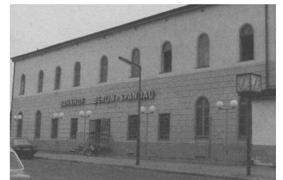
Auch Berlin--Spandau ist jetzt ein eigenständiger Tarifpunkt. Seit 1. Februar 1995 umfaßt der Tarifbegriff Berlin Stadtbahn nur noch die S-Bahn-Strecke von Berlin-Charlottenburg bis Berlin-Lichtenberg mit allen auf diesem Abschnitt liegenden Bahnhöfen.