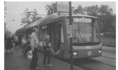
Im Gespräch für Berlin: Ein Zweirichtungszug, abgeleitet aus der Chemnitzer Variobahn, soll in Berlin getestet werden. Endlich, muß man hinzufügen, den schon lange fordert der Berliner Fahrgastverband IGEB Zweirichtungsfahrzeuge für die BVG.

Derzeitiges Hauptsorgenkind ist der Bereich Schöneweide, wo durch Autostaus eine katastrophale Situation entstanden ist. Die BVG erwartet erst nach der Sanierung der Stubenrauchbrücke eine Entspannung, da dies wieder zu einer Entlastung des