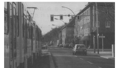
Typisches Beispiel für die Straßenbahn-Behinderung in Berlin: An der neuen Ampel Suermondstraße Ecke Degnerstraße in Hohenschönhausen ist zwar eine Anforderungsschaltung installiert, diese gewährt aber dem Straßenverkehr (einschließlich der Linksabbieger!) Vorrang - die Straßenbahn muß warten!