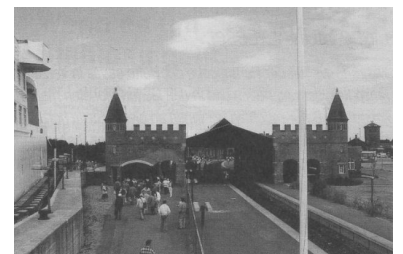
Gedser (Foto: Thomas Billik)

Vorbei. Zum kleinen Fahrplanwechsel am 25. September hat die Bahn die Zugverbindung Berlin - Kopenhagen mit dem Fährabschnitt zwischen Warnemünde und Gedser eingestellt. Unverständlich ist nicht nur diese Entscheidung, unverständlich ist auch, daß ein Ersatzangebot via Puttgarden der Öffentlichkeit verwehrt wurde. Zwar sind die Kurswagen kein gleichwertiger Ersatz für den Direktzug, aber immerhin eine Alternative zum weiten Umweg über Hamburg. Doch offensichtlich sind einige Bahnplaner daran ininteressiert, daß auch dieses Angebot mangels Nachfrage eingestellt werden kann. (Foto: Thomas Billik)