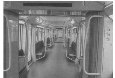
Besonders bemerkenswert ist, daß die der Baureihe H einen durchgehenden Fahrgastraum haben. Durch die ausschließliche Längsanordnung der Sitze wirkt der Zug innen breiter und verspricht eine Reduzierung des Angstgefühle in der abendlichen U-Bahn. Die Kehrseite ist ein reduziertes Sitzplatzangebot, weshalb der Berliner Fahrgastverband IGEB anregt, die vier mittleren, für den Fahrgastfluß weniger bedeutsamen Wagen mit Quersitzen auszustatten.