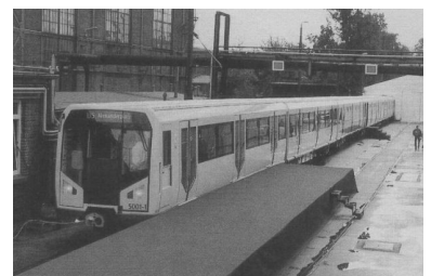
Präsentation des neuen Zuges der Baureihe H am 28. September auf dem Gelände der Waggon Union in Berlin--Reinickendorf.