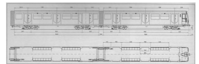
Die Abbildung zeigt zwei Wagen bzw. ein Drittel des neuen Zuges der U-Bahn-Baureihe H. (Abb.: ABB Henschel AG)

Mit der Entwicklung und Lieferung der insgesamt 115 modernen U-Bahn-Züge leistet ABB Henschel einen wichtigen Beitrag zu der geplanten Neugestaltung des Berliner U--Bahn-Systems. Die entscheidende Weichenstellung für die Realisierung des innovativen Zugkonzeptes erfolgte im Dezember 1992 mit dem Vertragsabschluß Zwischen den Berliner Verkehrsbetrieben und der ABB Henschel AG.