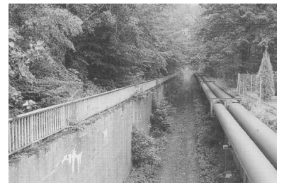
Nürnberg: Teile der ehemaligen Straßenbahntunnel können heute immerhin noch für Rohrleitungen genutzt werden...