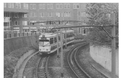
Ludwigshafen: Durch Tunnel in der Innenstadt wird die Straßenbahn in der zweiten Ebene geführt.