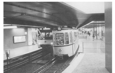
Stuttgart (Hbf.): Straßenbahntunnel mit Gleisen für zwei Spurweiten und hohen Bahnsteigen für Stadtbahnen sowie niedrigen für die Straßenbahn.