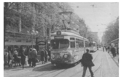
Mannheim: Erschließung von Fußgängerbereichen durch die oberirdisch geführte Straßenbahn